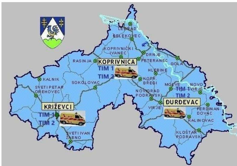
Fotografija br. 1.: Organizacija TIM-ova hitne medicinske službe na području Koprivničko-križevačke županije

Djelatnost sanitetskog prijevoza na području Koprivničko-križevačke županije obavlja 11 timova sanitetskog prijevoza, 22 zdravstvena radnika i 22 vozača, te 2 zdravstvena radnika u prijavno dojavnoj jedinici. Od toga je 10 timova propisano Mrežom hitne medicine i sanitetskog prijevoza), a 1 tim je dodatno s HZZO-om ugovoren temeljem Odluke o posebnim standardima i mjerilima njihove primjene u provođenju zdravstvene zaštite iz obveznog zdravstvenog osiguranja („Narodne novine“ broj 156/13). Sanitetski timovi obavljaju tzv. „hladni“ (nehitni) planirani prijevoz pacijenata sanitetskim vozilima, prijevoz osoba na hemodijalizu u 2-3 smjene dnevno, prijevoz u bolničke zdravstvene ustanove ili na kućnu njegu te premještaji pacijenata između zdravstvenih ustanova.