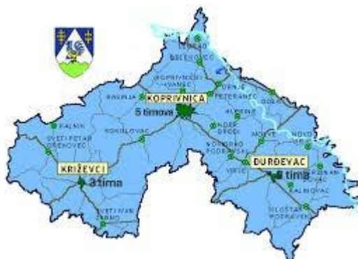
Fotografija br. 2.: Organizacija TIM-ova sanitetskog prijevoza na području Koprivničko-križevačke županije

Djelatnost sanitetskog prijevoza na području Koprivničko-križevačke županije obavlja 11 timova sanitetskog prijevoza, 22 zdravstvena radnika i 22 vozača, te 2 zdravstvena radnika u prijavno dojavnoj jedinici. Od toga je 10 timova propisano Mrežom hitne medicine i sanitetskog prijevoza), a 1 tim je dodatno s HZZO-om ugovoren temeljem Odluke o posebnim standardima i mjerilima njihove primjene u provođenju zdravstvene zaštite iz obveznog zdravstvenog osiguranja („Narodne novine“ broj 156/13). Sanitetski timovi obavljaju tzv. „hladni“ (nehitni) planirani prijevoz pacijenata sanitetskim vozilima, prijevoz osoba na hemodijalizu u 2-3 smjene dnevno, prijevoz u bolničke zdravstvene ustanove ili na kućnu njegu te premještaji pacijenata između zdravstvenih ustanova.